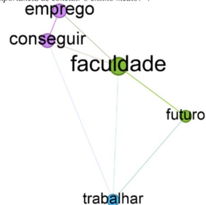
Figura 6: Rede de palavras referente à resposta de estudantes quilombolas à questão “Para você, qual a importância de concluir o ensino médio?”.